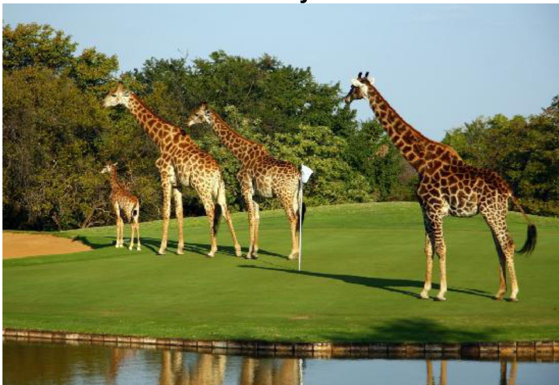
Ospiti inattesi al Golf Club