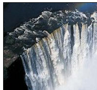
THE DURBAN SAFARI