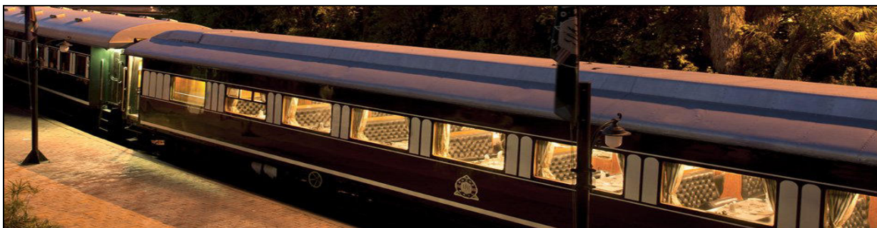
THE ROVOS RAIL

Questo itinerario di Rovos Rail di tre notti deve essere uno dei più iconici, poiché percorre circa 1 600 chilometri di paesaggi dell'Africa meridionale da Pretoria alla città di Victoria Falls. Partendo da Pretoria, Rovos Rail si snoda verso nord attraverso Warmbaths e Nylstroom. Il treno passa poi la scarpata e attraversa il Tropico del Capricorno in rotta verso il confine con lo Zimbabwe. La mattina dopo, attraversando lo Zimbabwe a Beitbridge, Rovos Rail continua verso la capitale del Matabeleland, Bulawayo. Il giorno seguente vede il treno percorrere uno dei tratti di linea ferroviaria più lunghi del mondo, prima di attraversare il Parco Nazionale Hwange, un luogo ricco e variegato, dove gli animali possono essere avvistati dal treno ed è prevista una sosta. Dopo una fermata di servizio a Thompsons Junction, il soggiorno termina all'incomparabile Victoria Falls sul potente fiume Zambesi. Le aree circostanti offrono ai viaggiatori molte opportunità ricreative tra cui crociere, rafting sulle rapide, safari e safari fotografici. Disponibile al contrario.