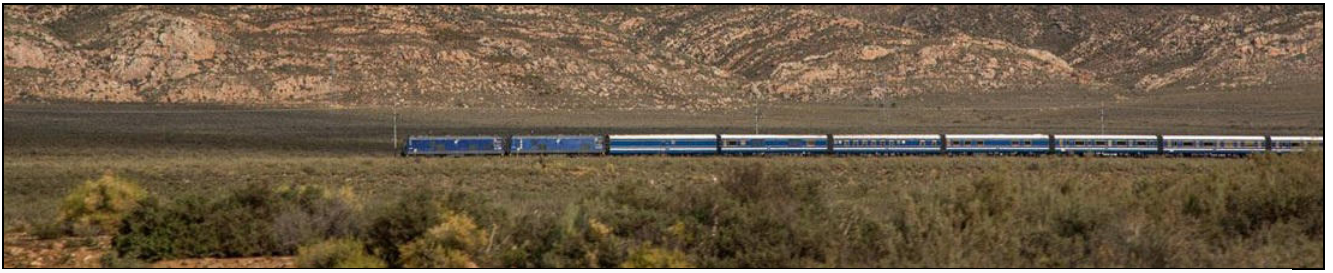
THE BLUE TRAIN ROUTES