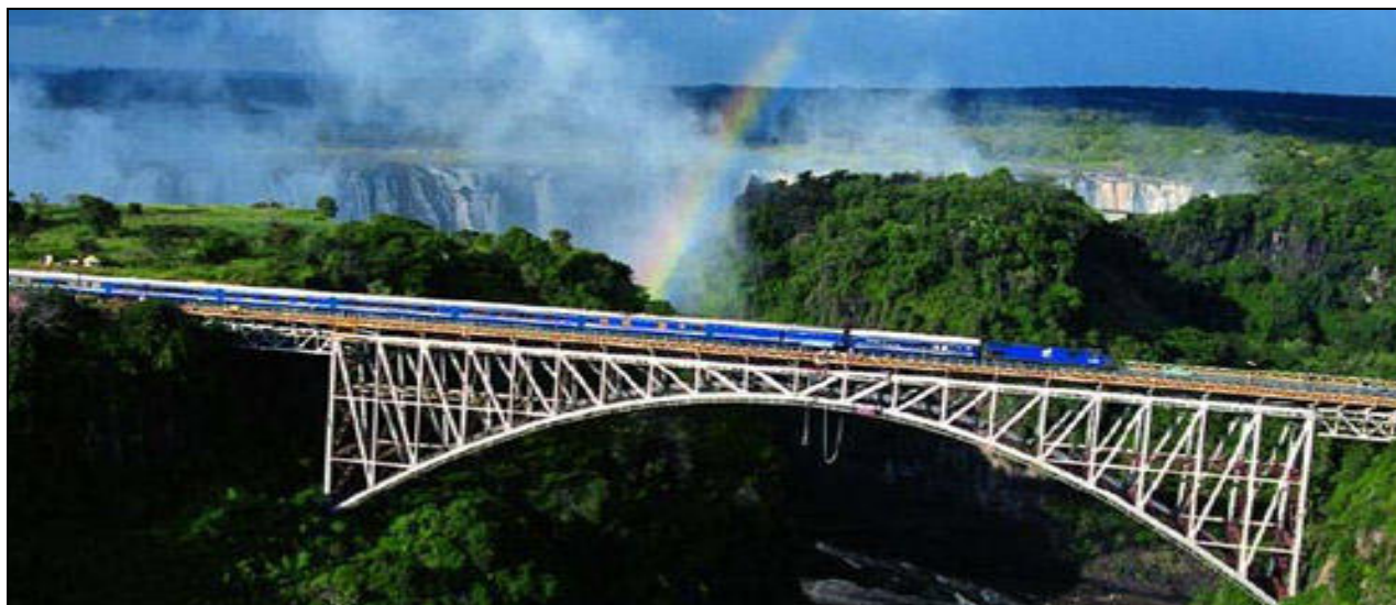
THE BLUE TRAIN in VICTORIA FALLS

“Il Blue Train ti offre un’ esperienza di viaggio in treno di lusso che ti porta attraverso paesaggi mozzafiato. ”