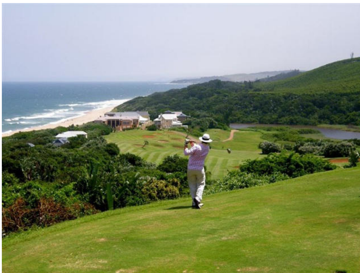
La splendida posizione panoramica del green