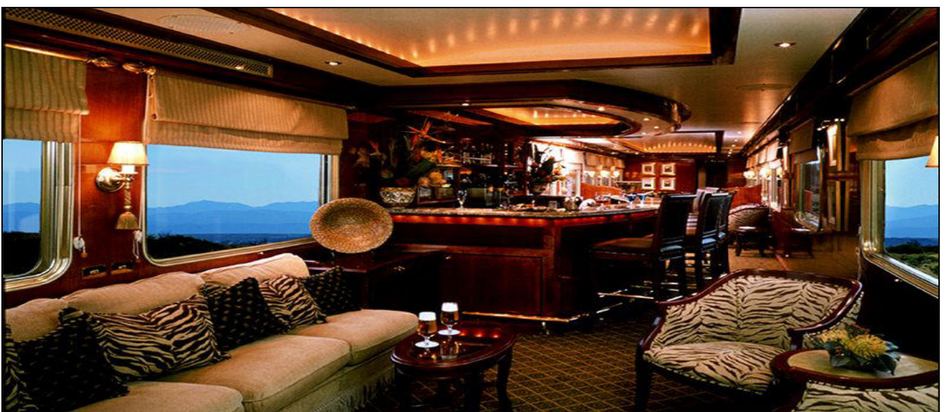
CLUB CAR LOUNGE

Durante il viaggio in direzione sud, il treno parte dalla stazione ferroviaria principale di Pretoria alle 8:30 e arriva a Cape Town alle 15:00 del giorno successivo. Sulla strada per Cape Town c'è una sosta e un'escursione a Kimberley, dove facciamo un passo indietro nel tempo ai giorni della corsa al diamante. Nel viaggio di ritorno, il treno parte da Cape Town alle 08:30 e arriva a Pretoria alle 15:00 del giorno seguente. Il treno blu ferma a Matjiesfontein per un'escursione. All'arrivo a Matjiesfontein, gli ospiti sono invitati per un bicchiere di sherry al bar. Gli edifici vittoriani e gli originali lampioni londinesi del XIX secolo trasmettono al viaggiatore, la sensazione di entrare in una distorsione temporale coloniale - un'oasi sospesa in un'epoca diversa. Nel 2019 il Blue Train Journey tra Cape Town e Pretoria sarà esteso a due notti .