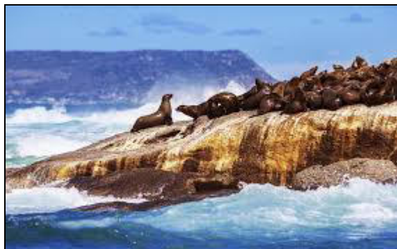
Foche a Skeleton-coast