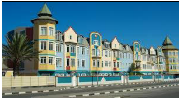
L'elegante cittadina di Swakopmund