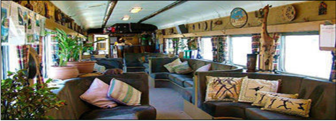
THE SONGOLOLO LOUNGE