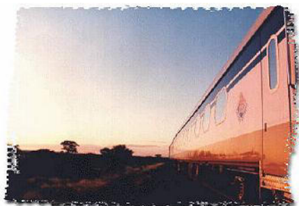
The Desert Express

Attraversare il deserto del Namib tra Windhoek e Swakopmund una volta alla settimana, in base alla disponibilità, godendoti i migliori piatti da tre portate, i migliori vini e le vedute sulla bellezza senza pari del paesaggio namibiano.