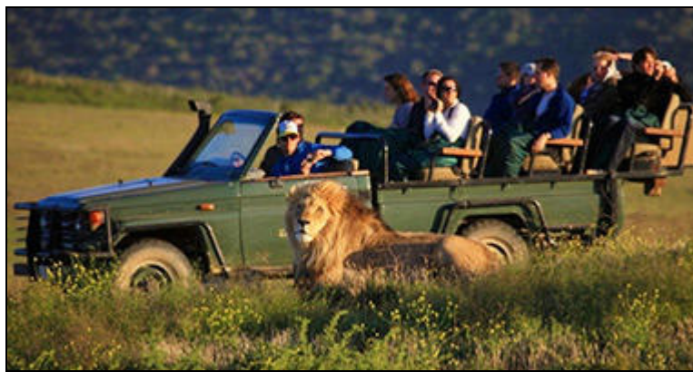
An Unforgettable Journey