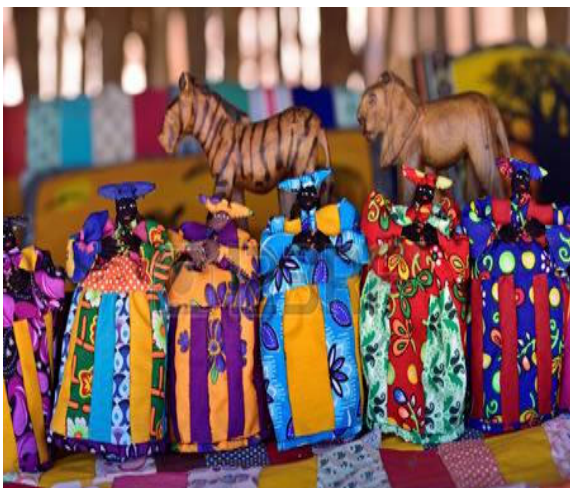
Bancarella di Bambole Herero fatte a mano