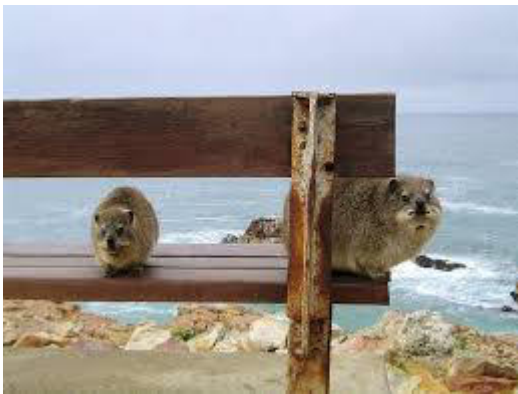
Dassies sulla panchina panoramica

Colonie di Dassies, (il Dassies è un mammifero molto popolare e socievole), affollano le rocce dove nidificano anche molti uccelli marini tra cui il cacciatore di ostriche nere.