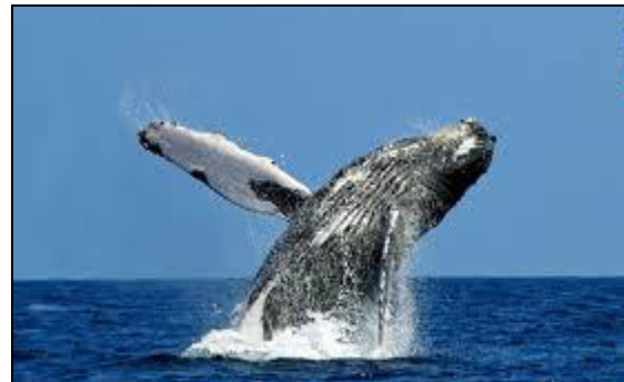
Megattere e balene

Le megattere migratrici possono essere viste di passaggio da maggio a giugno e nel viaggio di ritorno, da novembre a gennaio. Occasionalmente si possono avvistare anche le orche.