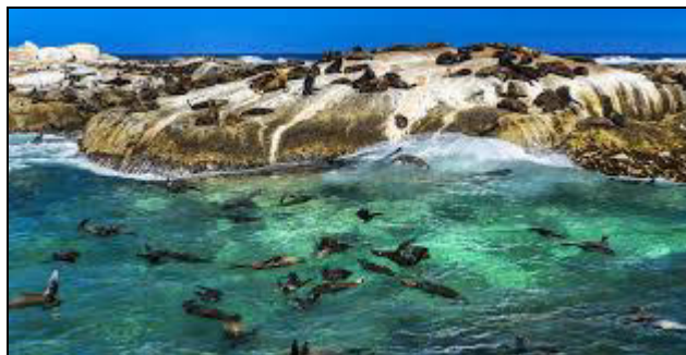
Colonia di foche

Una grande colonia di foche di mantello del Capo, conta circa 3000 esemplari e occupa la ripida costa settentrionale riparata.