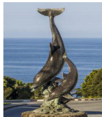
Statua dei delfini

Recentemente Plettenberg Bay è diventata punto di riferimento per i turisti, e offre molte attività per il tempo libero. Dal polo di Kurland, al diportismo alla foce del fiume Keurbooms e al porto turistico, ad attività come il nuoto e gli sport acquatici nelle calde acque. Quando entri nella città vera e propria, trovi un monumento a uno dei simboli di questa lussureggiante baia tropicale: una statua in bronzo di delfini che giocano .