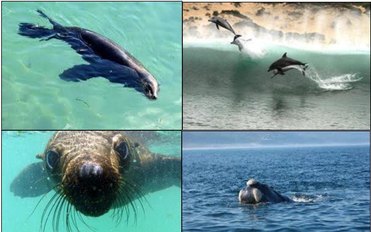
foche e delfini

Una grande colonia di foche di mantello del Capo, conta circa 3000 esemplari e occupa la ripida costa settentrionale riparata.