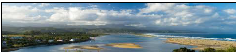
Estuario – bocca del fiume Keurbooms

Recentemente Plettenberg Bay è diventata punto di riferimento per i turisti, e offre molte attività per il tempo libero. Dal polo di Kurland, al diportismo alla foce del fiume Keurbooms e al porto turistico, ad attività come il nuoto e gli sport acquatici nelle calde acque. Quando entri nella città vera e propria, trovi un monumento a uno dei simboli di questa lussureggiante baia tropicale: una statua in bronzo di delfini che giocano .