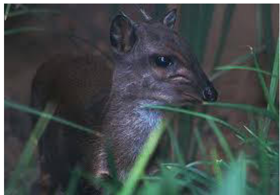
La piccola Antilope Duiker blu

Il raro duiker blu (l'antilope più piccola del Western Cape) e il pesce romano che cambia sesso sono solo due delle specie che trovano rifugio in questa riserva marina.