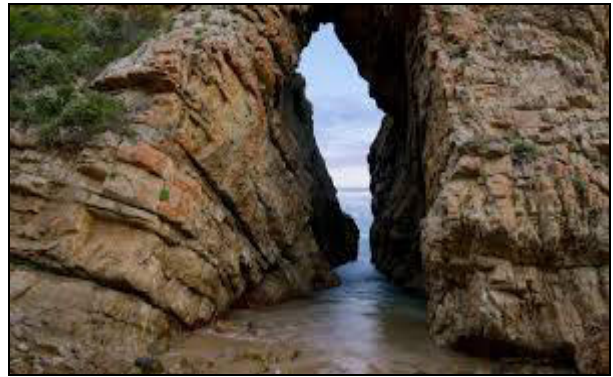
Arch Rock Plettenberg Bay

Dato che Robberg è una delle migliori escursioni di SA, la vita marina e l'avifauna, così come i piccoli mammiferi terrestri, si aggungeranno agli avvistamenti.