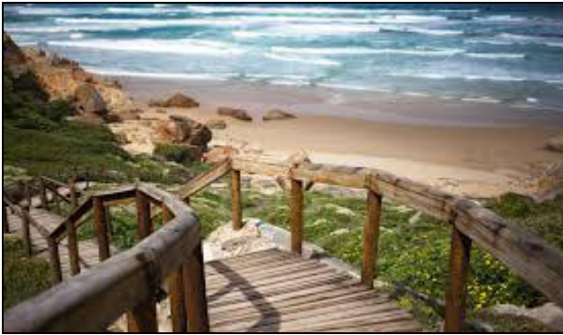
Passerella fino alla spiaggia