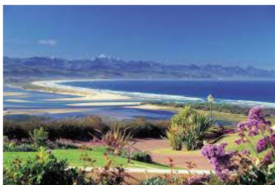
Scorcio di Plettenberg Bay

La città di Plettenberg Bay si trova quasi al confine tra la parte occidentale e quella orientale. Costruita sul fianco della collina, la maggior parte della città si trova su un ripido pendio che scende verso il mare, il che significa che, indipendentemente da dove vi troviate, vedrete viste spettacolari sulla baia, sulle colline e bellissime montagne circostanti. E' considerata la Portofino del SudAfrica.